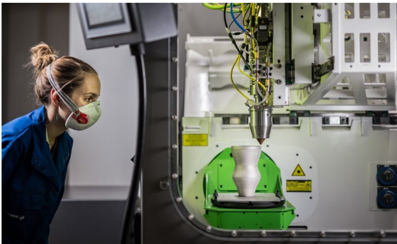
Safran - Fabrication additive déposition métallique par laser-LMD