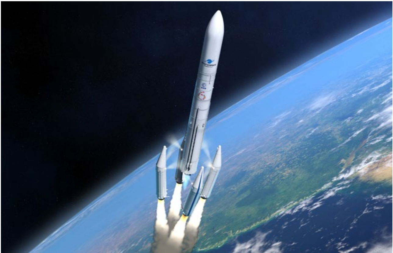
ArianeGroup - Ariane 6