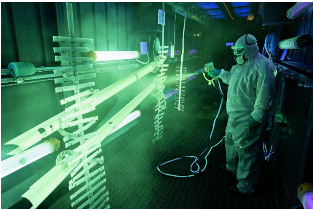
Dassault Aviation - Cabine de ressuage

A noter qu'un certain nombre de Licences Professionnelles ont été intégrées dans le cursus de 3ème année de BUT lors de leur évolution ou création.