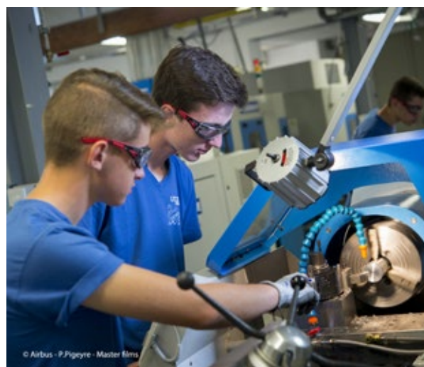
Airbus - Techniciens usinage fabrication 3D