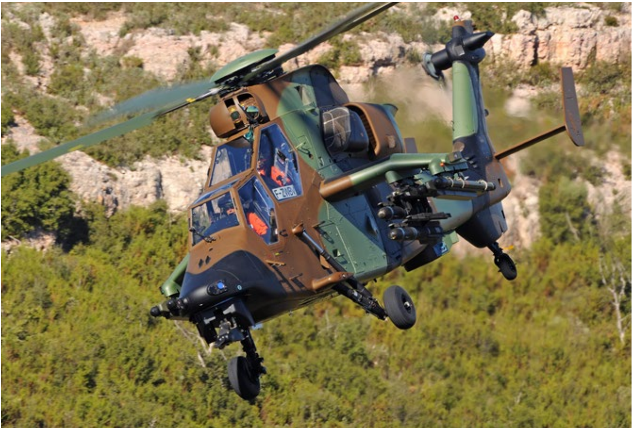
Airbus Helicopters - Tigre HAD