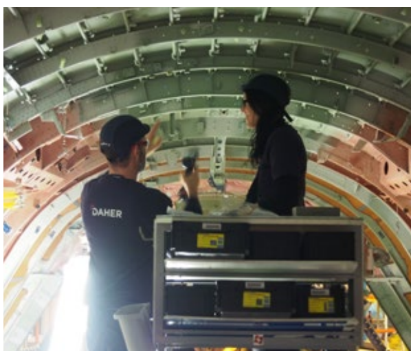
Daher - Intégrateurs cabine