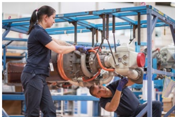
Liebherr - Monteurs/Monteuses Mécaniciens/Mécaniciennes - © Liebherr

(*) A compter de la session d'examen 2025, l'intitulé du diplôme de « Mention Complémentaire » devient « Certificat de Spécialisation ». La Brochure Formations GIFAS anticipe cette évolution. Sur certains sites d'établissements, l'intitulé « Mention complémentaire » apparaît encore, il sera progressivement remplacé par le nouvel intitulé.