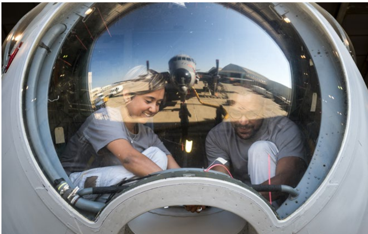
Dassault Aviation - Mécaniciens avionique