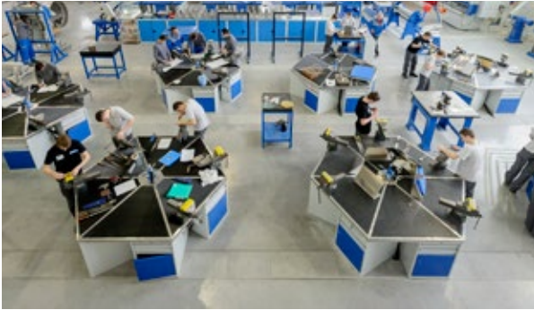
Lycée Henri Potez - STELIA Aerospace - Hall technique

A comme Apprentissage : formations ouvertes à l'apprentissage