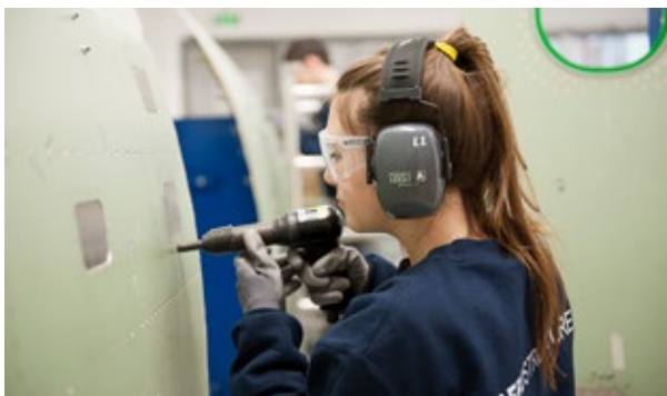
Lycée Marcel Dassault - Activité aéronautique structure