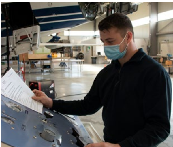
AFMAE - Apprentis en Bac pro aéronautique option systèmes