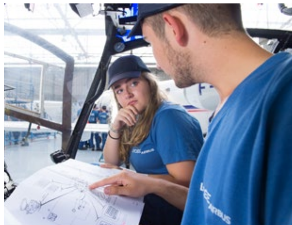
Lycée Airbus- Techniciens aéronautiques option systèmes