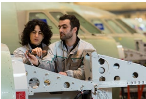
Dassault Aviation - Falcon - Chaîne d'assemblage